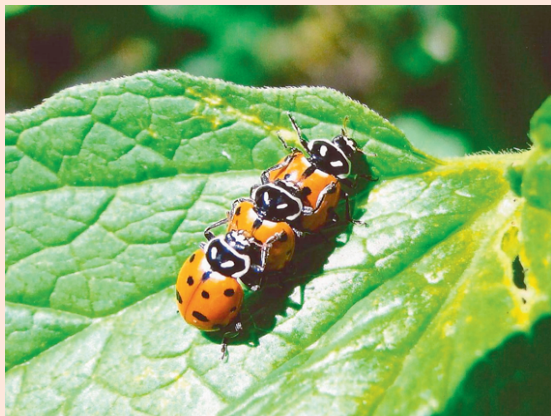
"Trio parada dura"

Neste e nos próximos números do ISEB estaremos divulgando as três imagens premiadas no Concurso de Fotografias do XXIV CBE.