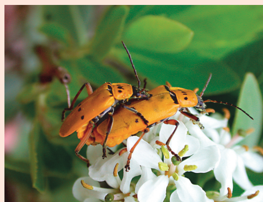
"Encontro sobre flores"