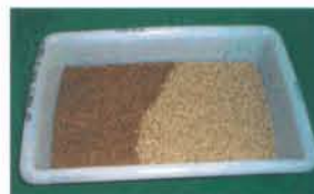
Fig. 1. Linhagem V8- tsl6 . Pupários marrons (machos) e brancos (fêmeas).

tamento térmico, pois é a matriz para dar continuidade à colônia, onde fêmeas e machos são necessários (Fig. 1). Todo o processo de produção tem de ser perfeito,