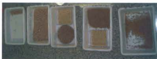
Fig. 2. Linhagem V8- tsl69 . Diferentes fenótipos de pupários.

pois qualquer desatenção ou estresse (principalmente o de temperatura) pode causar o aparecimento de "recombinantes" (machos em pupários brancos e/ou fêmeas em pupários marrons) ou a perda total das fêmeas. Outra característica da linhagem V8- tsl é a fêmea necessitar de maior tempo para o desenvolvimento larval. No primeiro dia de coleta de larvas, quase a totalidade é de machos, assim como no último (em média no quinto dia) é de fêmeas (Fig. 2). A linhagem V8- tsl já está sendo avaliada e estudada desde dezembro/ 2004 no Laboratório de